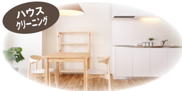
室内脱臭(タバコ臭・カビ臭・ペット臭など)