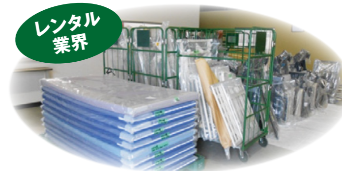
レンタル品の除菌