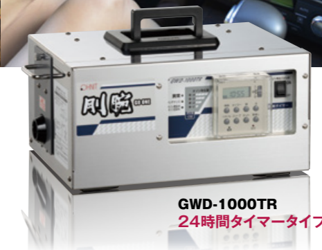
GWD-1000TR 24時間タイマータイプ