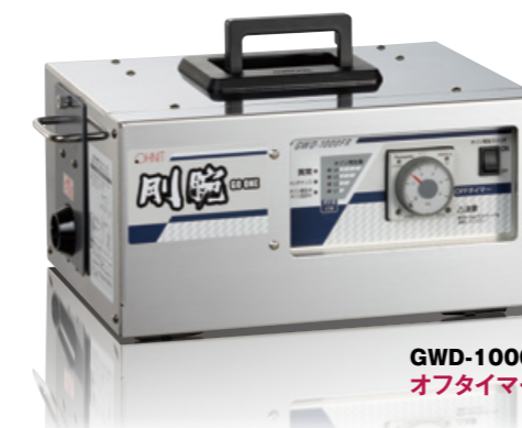
GWD-1000FR オフタイマータイプ