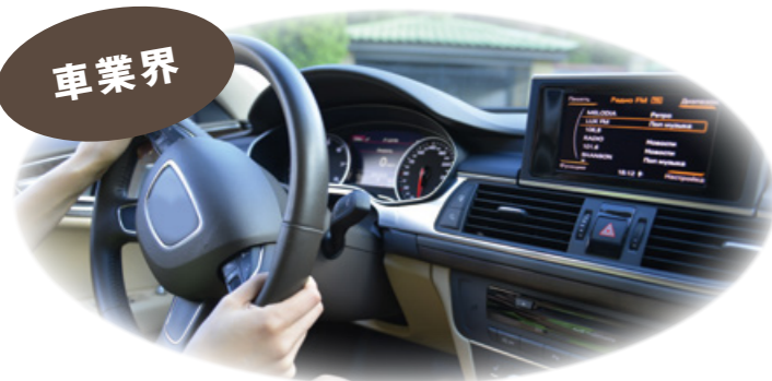
エアコン脱臭(タバコ臭・カビ臭など)